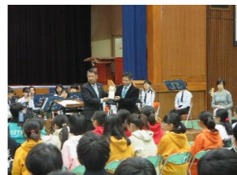
歓迎式典で記念品交換