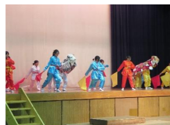
民族衣装での踊りを披露