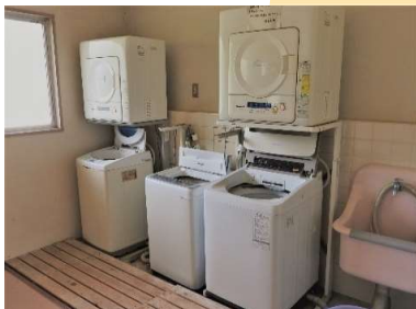
男女別ランドリールーム