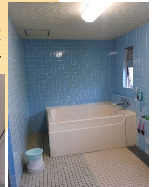
男女別浴室 男子1階・女子2階