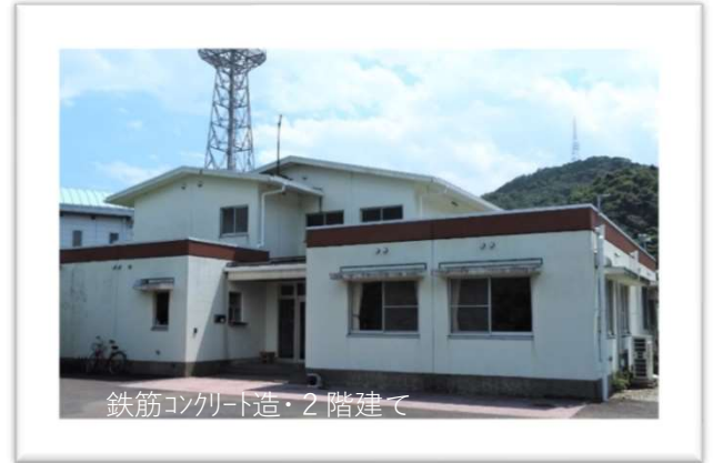
鉄筋コンクリート造・2階建て

新高・新翔生で、自宅からの通学が困難な などの事情がある生徒のための寄宿舎です。 新宮高校のテニスコート・弓道場に隣接す る場所にあります。