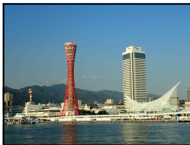
ハーバーランドからの眺め